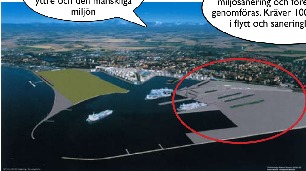
Bilden visar Trelleborgs Hamns Framtidsvision. Utbyggnaden/uppställningsplatsen till höger påverkar en mycket stor del av tätbebyggelse i Trelleborg, samt Östersjön och kustlinjen.

Det blir ökad miljöpåverkan, både för den yttre och den mänskliga miljön